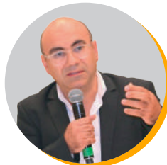
Pr. Karim BAINA Professeur Ecole Nationale Supérieure d'Informatique et d'Analyse des Systèmes (ENSIAS)